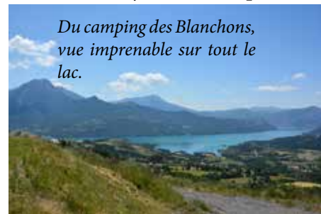
Du camping des Blanchons, vue imprenable sur tout le lac.

Situé entre le lac et la montagne de Chabrières, avec ses 20 emplacements, son gîte de 6/8 places, des services tels que : aire pour les groupes, salle de jeu, terrain de volley, de pétanque, jeu pour les enfants, des frigos à disposition, un sanitaire pour personne à mobilité réduite, ce camping arbore les 2 étoiles. Même en haute saison c'est une équipe familiale qui accueille les vacanciers. Le camping est ouvert du 1er juin au 04 septembre.