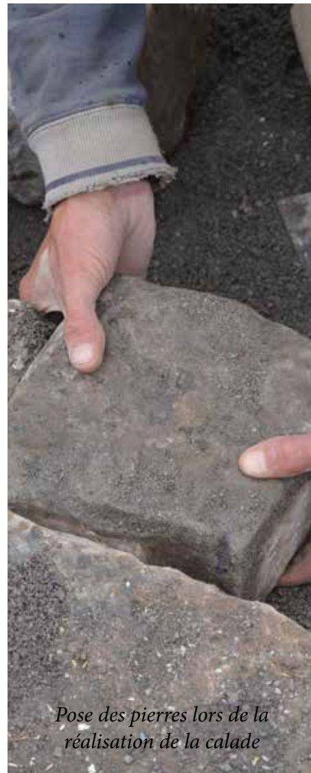
Pose des pierres lors de la réalisation de la calade