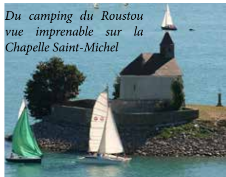
Du camping du Roustou vue imprenable sur la Chapelle Saint-Michel

Situé au bord du lac, c'est le plus vaste en terme de superficie avec 9 ha exploitables. Avec ses 230 emplacements, 30 bungalows, des services tels que : Bar, restaurant, piscine, tennis, plage privée, rampe de mise à l'eau avec ponton et bouée, ce camping arbore les 3 étoiles. En haute saison c'est une équipe de 12 personnes au service des vacanciers. Le camping est ouvert du 10 mai à fin septembre.