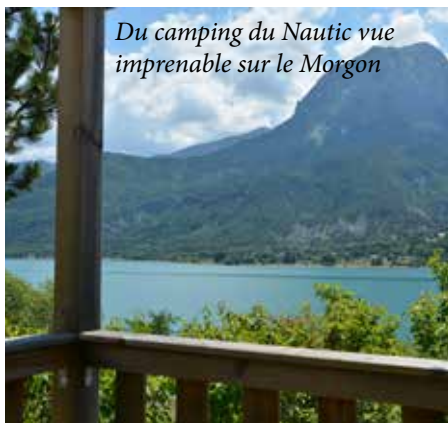
Du camping du Nautic vue imprenable sur le Morgon